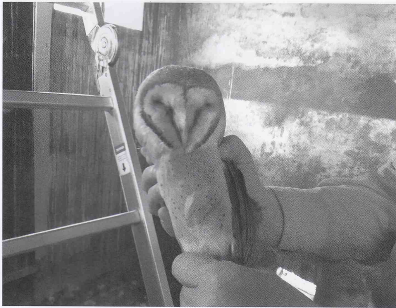
De Kerkuil wordt geringd